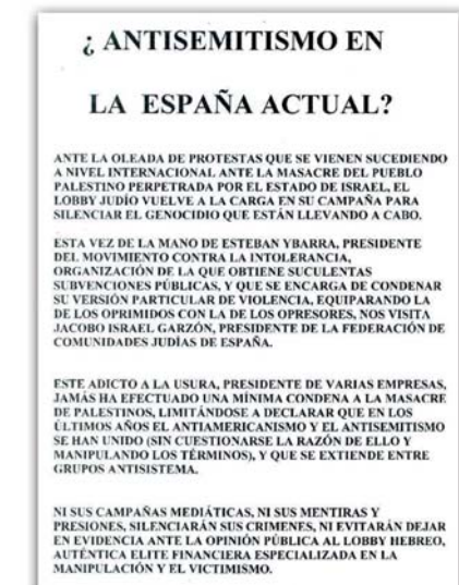
Panfleto repartido en la UCM - Madrid, Abril 2009