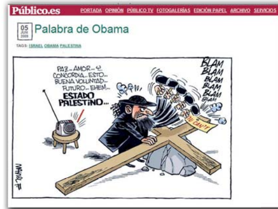
Público.es - Manel Fontdevilla Edición Digital - 05/06/2009