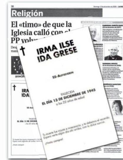
Página de La Razón 13/12/2009