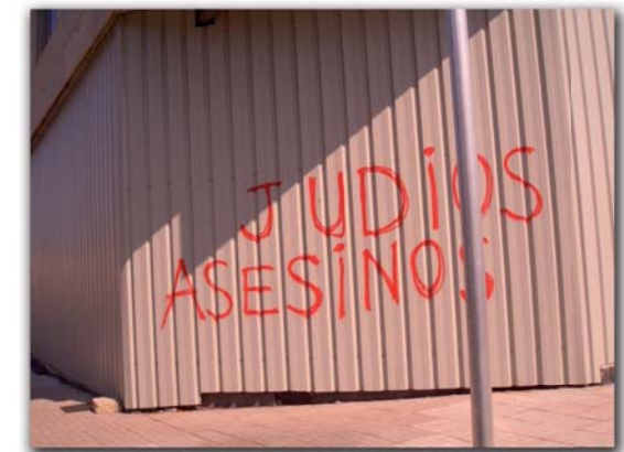
Pintada antisemita - Pontevedra Nov 2009