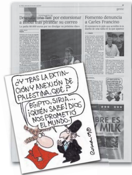
El País - Romeu Edición Impresa - 14/01/2009