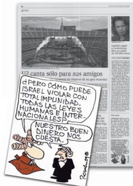
El País - Romeu Edición Impresa - 30/06/2009